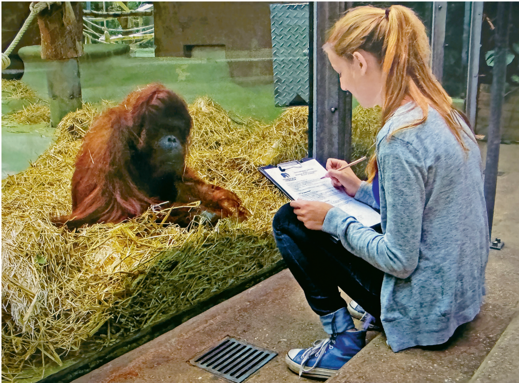
Wer beobachtet hier wen? Eine junge Beobachterin und Tilda , ein Borneo-Orang-Utan im Zoo Köln, 1.7.2014.

In Hedigers tierpsychologischem Plädoyer ist ein Dutzend aussichtsreicher Themenbereiche genannt, sich dem wie immer gearteten «tierlichen» Bewusstsein zu nähern. Damit schließt sich der Kreis zur beschreibend-analytischen Verhaltenskunde.